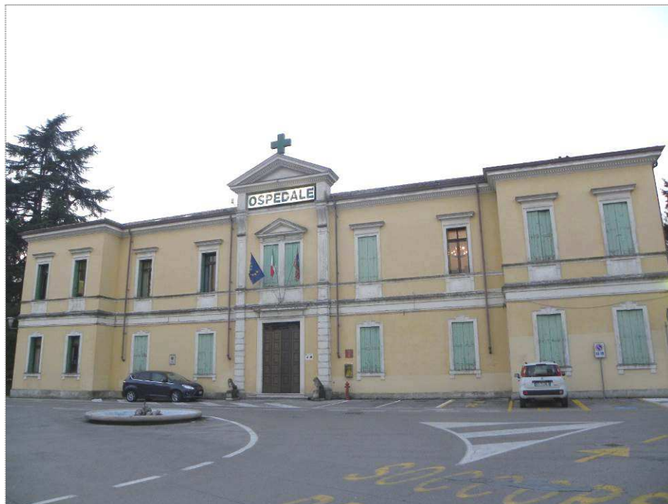
Ospedale Civile di Milano: Dirigenza medica (mp.508) - esterni