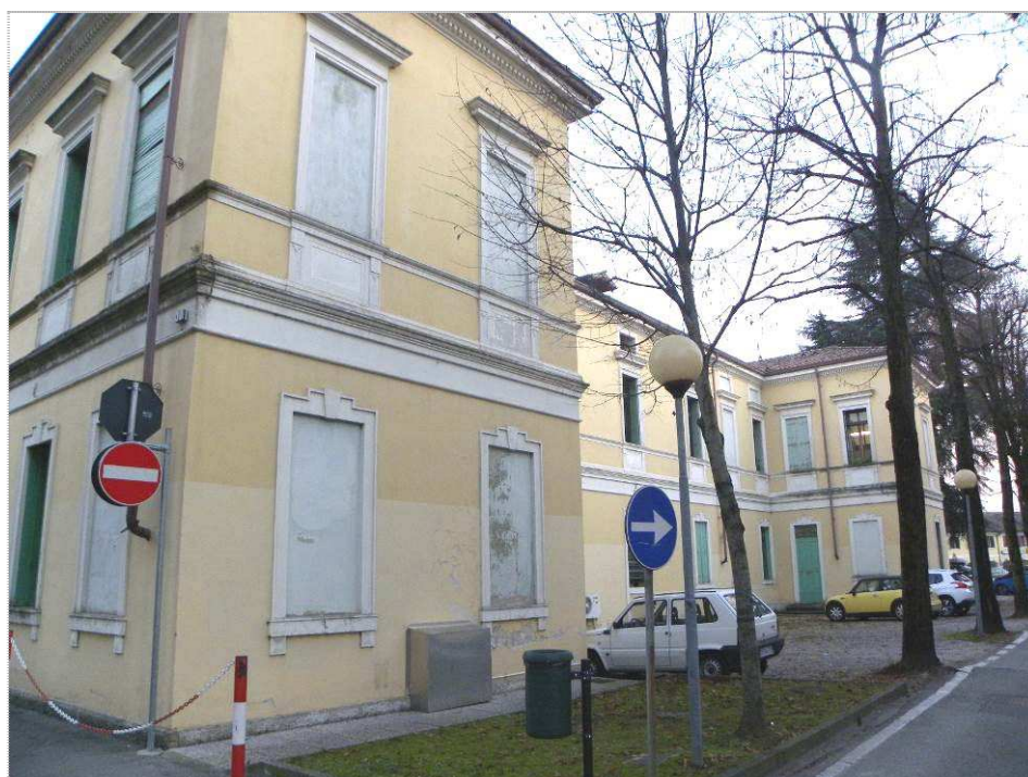
Ospedale Civile di Milano: Dirigenza medica (mp.508) - esterni